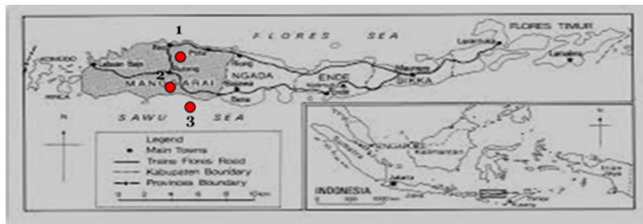
Gambar 1. Informasi tentang Lokasi penelitian: (1) SMP Negeri 1, (2) SMP Swasta Katolik, (3) SMP Islam Swasta

Sumber data didasarkan pada orang dan lingkungan sekolah. Data diperoleh melalui wawancara terstruktur dengan kepala sekolah, guru, siswa, orang tua, komite sekolah, dan tokoh budaya setempat. Para peserta dipilih untuk mendapatkan informasi terkait alasan utama sekolah memasukkan nilai-nilai moral budaya lonto leok sebagai branding sekolah. Selain itu, untuk memperoleh informasi tentang praktik kepemimpinan transformasional kepala sekolah berdasarkan dimensi pengajaran lonto leok. Kedua fokus penelitian ini diselidiki dan dijelaskan untuk membuktikan bahwa sekolah telah menerapkan PPK secara optimal. Wawancara mendalam digunakan untuk mengungkapkan sudut pandang peserta dalam menafsirkan orang, fenomena, kegiatan organisasi, perasaan, motivasi, dan pengakuan terhadap fokus penelitian (Miles dkk., 2014). Di sisi lain, pengamatan dilaksanakan untuk secara mendalam mengenali ukuran kelompok tertentu, nilai-nilai perilaku masing-masing individu, keyakinan, dan cara masing-masing peserta untuk menyelesaikan tugas di sekolah. Pengamatan difokuskan pada partisipasi peneliti dengan orang-orang yang terlibat di dalamnya (Creswell, 2012). Pengamatan sangat penting untuk melengkapi dan menguji validitas data dengan membandingkan hasil wawancara dengan hasil pengamatan. Dengan demikian, data yang diperoleh menjadi lebih komprehensif.