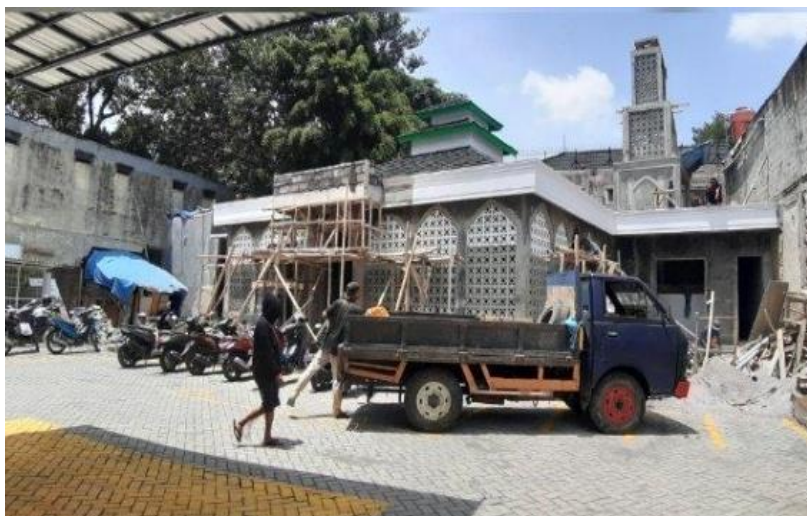
Masjid Nurul Ikhlas direlokasi dibelakang Indomaret

Dinas Budaya dan Pariwisata Kota Bandung (Didsbudpar) berjanji akan menindaklanjuti agar pelanggaran hukum PT KAI dan atau PT Indomarco dapat dikenakan sanksi sesuai dengan peraturan perundang-undangan yang berlaku.