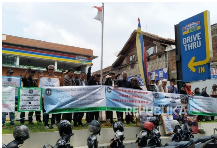
Kegiatan demo pengelola Masjid dan warga kepada PT KAI 2023

Dalam tinjauan 2 minggu ini, warga sekita yang melakukan Salat Jumat di Masjid Nurul Ikhlas sekitar 30-40 orang paling tinggi, sisanya sekitar 20-30 orang merupakan wisatawan (kondisional ketika wisatawan sedang ramai ke Cihampelas) yang sedang berwisata ke Bandung.