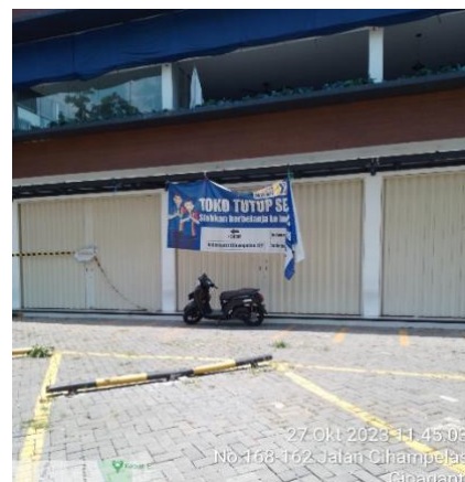
Penyegelan Bangunan Indomaret cihampelas 149, Maret 2023