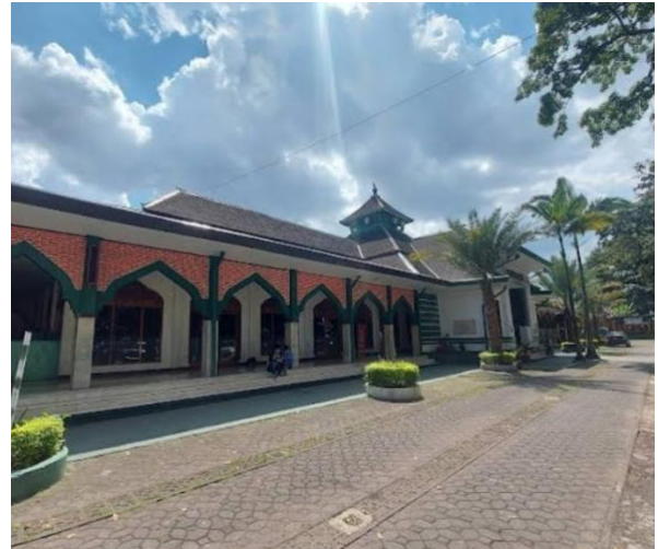
Jarak Masjid Nurul ikhlas ke Masjid Raya Cipaganti

Kasus utama yang menjadi konsentrasi pada sengketa tanah masjid ini adalah, ketika masyarakat sekitar menjadi pengguna tujuan dan fungsi Masjid Nurul Ikhlas Cihampelas ini yang sebelumnya sudah biasa digunakan dengan baik. Kapasitas masjid Nurul ikhlas, pada bangunan masjid baru adalah bisa menampung 90-100 orang ketika melakukan salat Jumat.