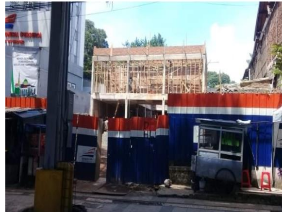
Pembongkaran Masjid Nurul Ikhlas oleh PT KAI tahun 2019

Penyebutan penghancuran cagar budaya dalam problem masjid ini, adalah pembongkaran bangunan Masjid Nurul Ikhlas yang awalnya termasuk kategori bangunan cagar budaya. Pembongkaran bangunan Masjid Nurul Ikhlas dilakukan oleh PT Kereta Api Indonesia tahun 2019, bangunan lokasi awal Masjid ini dirubah menjadi Indomaret. Dan lokasi masjidnya menjadi diarea belakang lahan dan dibelakang Indomaret.