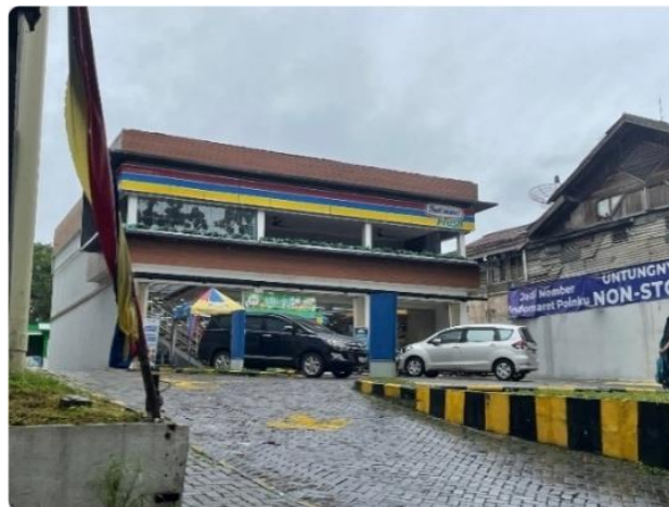
Bangunan indomaret cihampelas 149

Kondisi saat ini, Masjid Nurul Ikhlas yang sebelumnya merupakan bangunan cagar budaya, wakil Ketua III DPRD Kota Bandung Edwin Senjaya (2022) menyatakan sepakat bahwa alih fungsi bangunan cagar budaya Masjid Jami Nurul Ikhlas yang berlokasi di Jalan Cihampelas Nomor 149 menjadi sebuah minimarket, yaitu Indomaret telah melanggar ketentuan hukum.